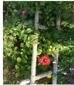
夏の花ハイビスカスがコスモスのとどろきに