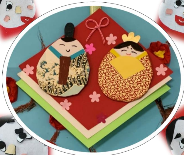
今年は壁飾りのお雛様

立春前、暖かい日が続き庭の梅の花が満開になりました。メジロがやってきて花の蜜をついばむ姿にほっこりしました。