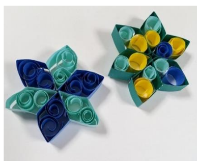
クリスマスオーナメント