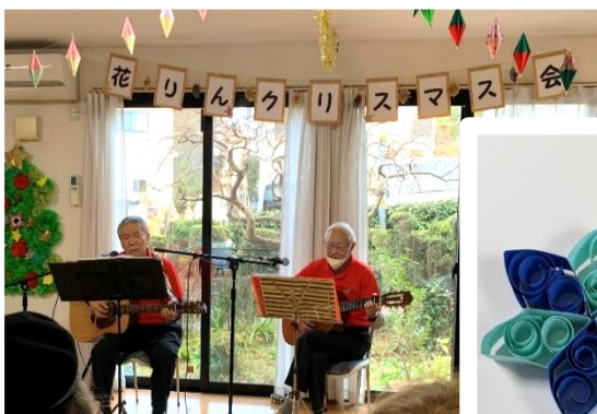
花りんクリスマス会