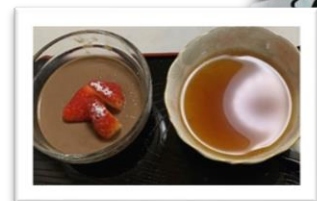
チョコムース苺添え

立春前、暖かい日が続き庭の梅の花が満開になりました。メジロがやってきて花の蜜をついばむ姿にほっこりしました。