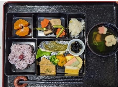
お正月の松花堂弁当